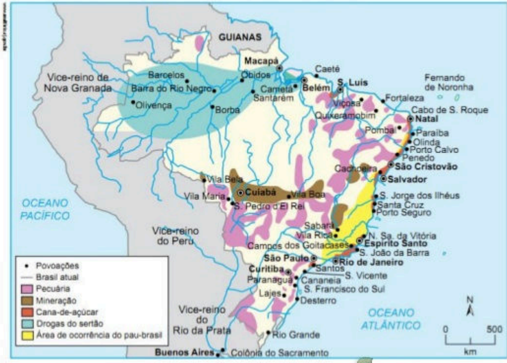
Mapa econômico do Brasil – Século XVIII