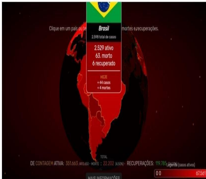
Figura2:Disponível em: https://www.covidvisualizer.com/ . Acesso em: 26 mar 2020 - 11h 42min.

Responda de acordo com as informações da imagem acima no caderno: