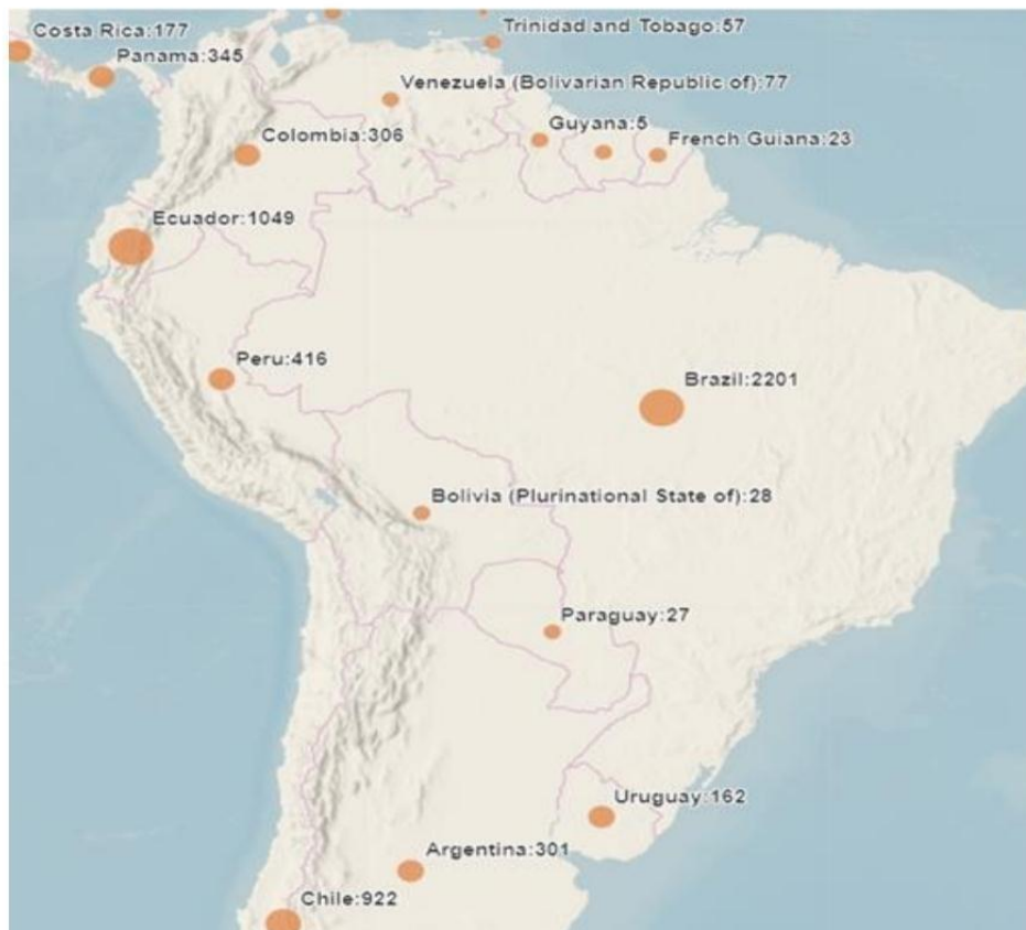
Figura 1: Número de casos do Coronavírus por país, no dia 25 de março de 2020.