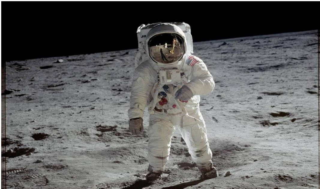
3- Pegada deixada na Lua por um astronauta.