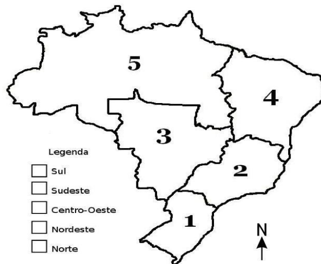
Brasil - Divisão Regional (IBGE)

2- Agora no mapa da página 285 Localize os Estados que fazem parte de cada região do Brasil e escreva os nomes na tabela abaixo: Para te ajudar segue um mapa das regiões, repare que neles só estão os nomes das regiões. Para comparar e ver o nome de cada Estado, olhe na apostila.