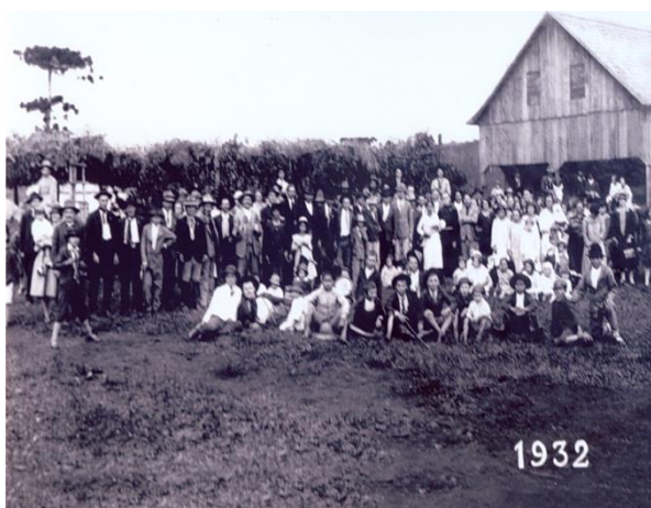
1932 – Vila Encruzilhada (todos os moradores)