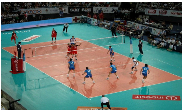
Partida de voleibol entre Itália e Rússia (2005)

O objetivo principal é lançar a bola por cima da rede e fazê-la tocar no chão do adversário.