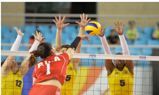
Exemplo de bloqueio no vôlei feminino

Observe que os bloqueios são realizados por dois ou mais jogadores que estão posicionados próximos da rede. Sendo assim, para se defender contra o ataque do adversário eles saltam no mesmo momento.