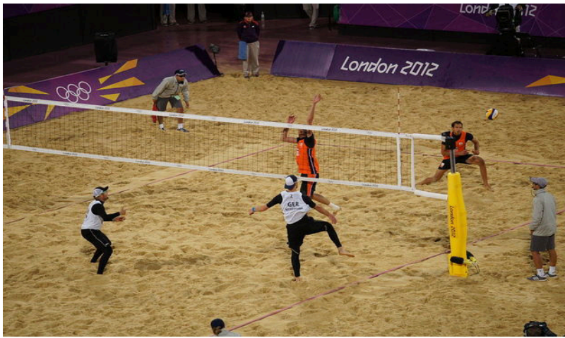
Partida de vôlei de praia entre Alemanha e Países Baixos (2012)

Além do vôlei de quadra, há também o vôlei de praia . Diferente da quadra, o de praia é jogado na areia e contém somente quatro jogadores, sendo dois de cada equipe.