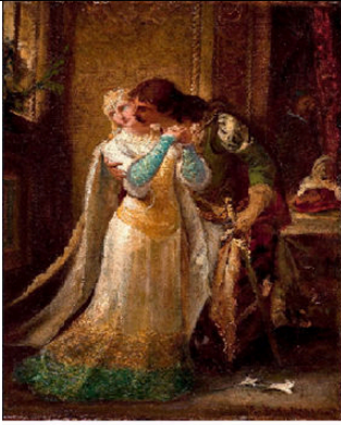
Fausto e Margarida - Pedro Américo