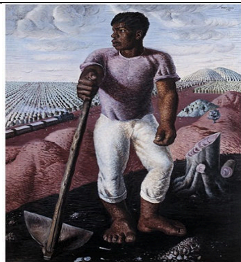
Portinari - O lavrador de café - 1939