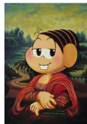
Mônica Lisa Maurício de Sousa