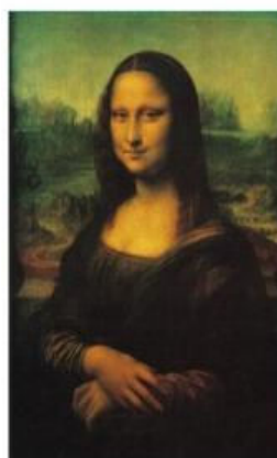
Mona Lisa Leonardo da Vinci