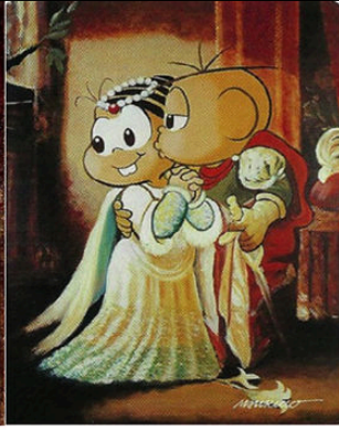
Fausto-Cebolinha e Mônica-Margarida - Maurício de Souza

E assim, a cada tela concluída, Maurício se via mais envolvido com suas homenagens aos pintores consagrados, conforme o Livro História em Quadrões, até o ano de 2001 foram realizadas 37 paródias das obras de artistas como: Van Gogh, Sandro Boticelli, Michelângelo, Diego Velásquez, Francisco Goya, Claude Monet, Édouard Manet, Rembrandt, Edgar Degas, Gauguin, Eckhout, GaiQi, Jacques Louis David e Toulouse-Lautrec.