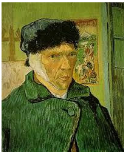
Autorretrato com a Orelha Cortada (1888)

Arrependido, corta um pedaço de sua orelha e manda num envelope para Gauguin. É recolhido para o hospital e em seguida vai para casa e pinta o Auto Retrato com a Orelha Cortada (1888).