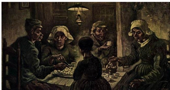
Os Comedores de Batata (1885)

Em março de 1885 seu pai morre repentinamente. Em abril do mesmo ano, Van Gogh pinta Os Comedores de Batata , caracterizado pelas tonalidades escuras.