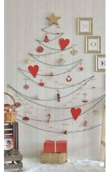
CORDÃO OU BARBANTE