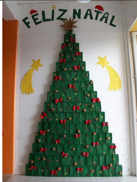
CAIXINHAS DE LEITE