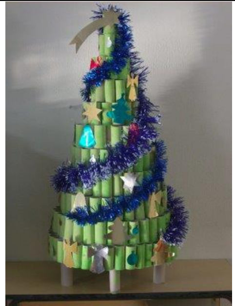
ROLINHOS DE PAPEL