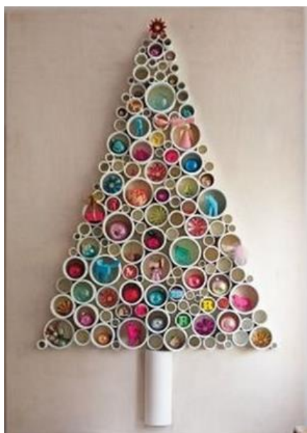
RESTOS DE CANO PVC