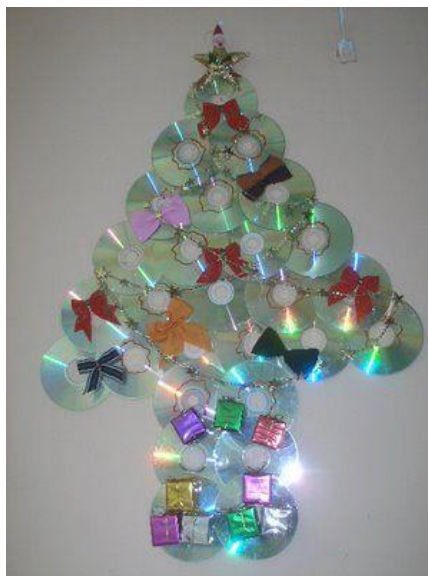
COM CD VELHO