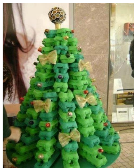
COM CAIXAS DE OVOS