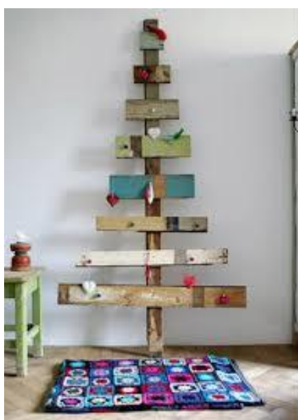
MADEIRA DE DEMOLIÇÃO