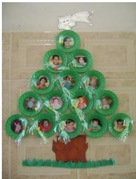
COM PRATOS DESCARTÁVEIS

Chegou a hora de montar uma árvore de natal, para essa atividade vamos usar materiais recicláveis, vou deixar algumas opções de árvores recicláveis, escolha o que mais tiver possibilidade de fazer e recrie, a criança irá precisar da ajuda de um adulto. Lembrando que nesse pinheiro pode ser colocado os enfeites de massa de sal feitos anteriormente.