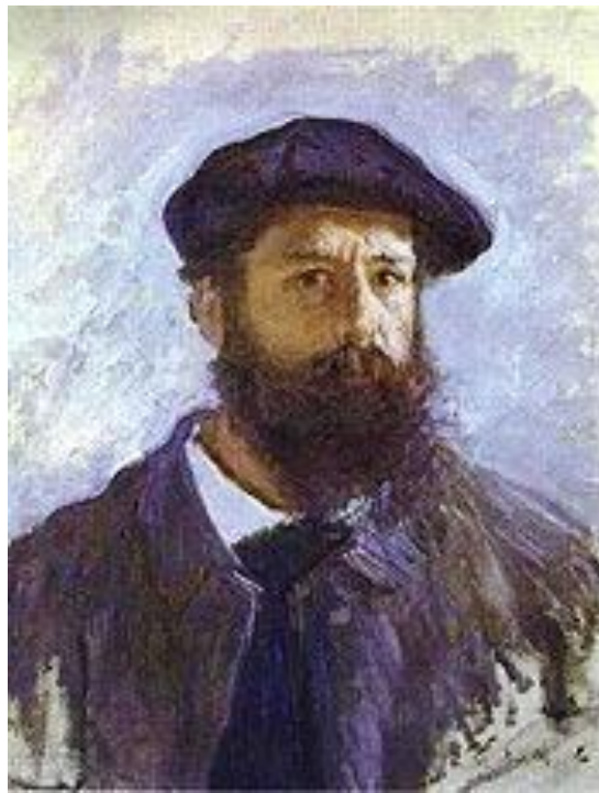
Claude Monet, 1886