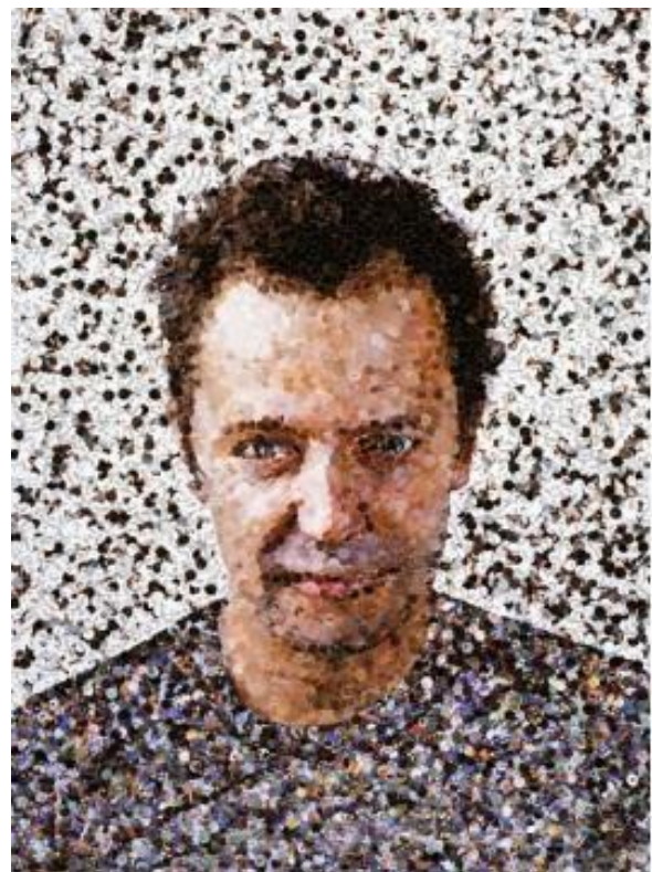
Vik Muniz, Série Pictures of Magazines, 2003