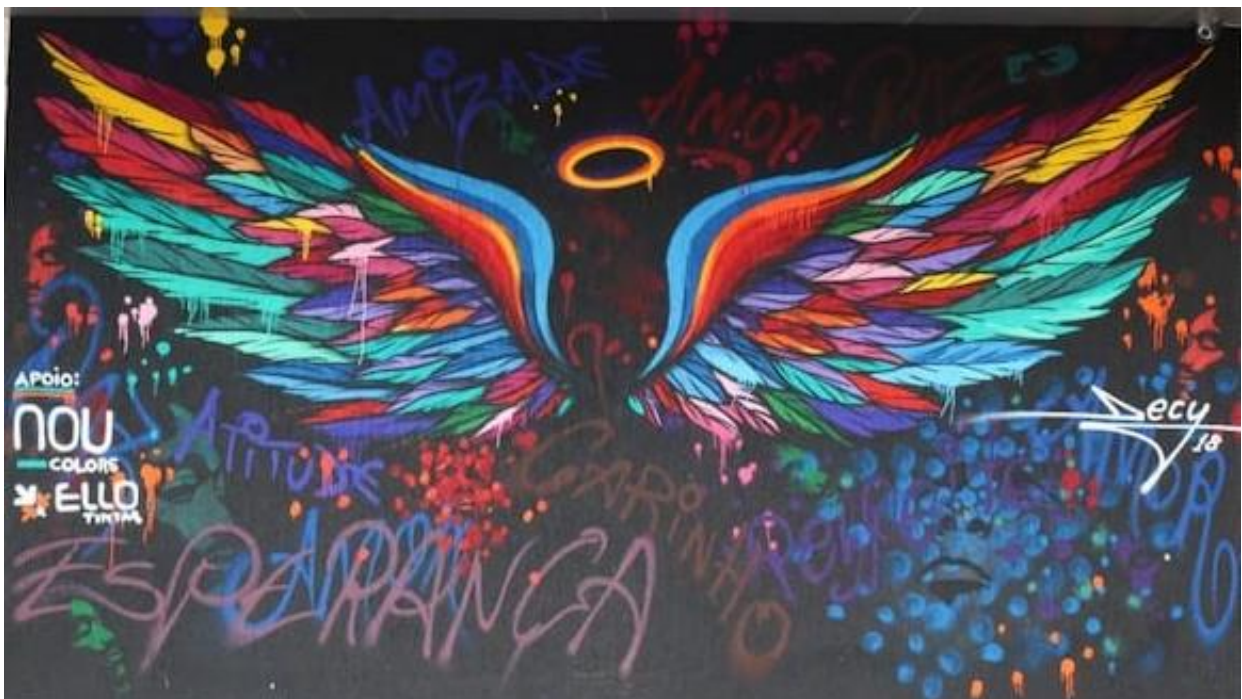
Asas na Rua 24, no Centro de Goiânia. Obra é de Decy Graffiti