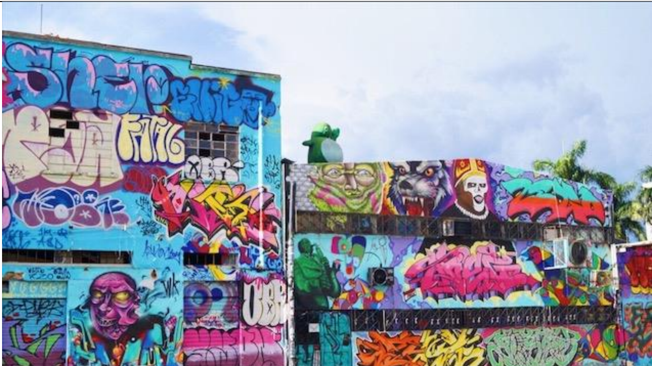
Beco da Codorna, Av. Anhanguera, nº 5331 – Centro, Goiânia