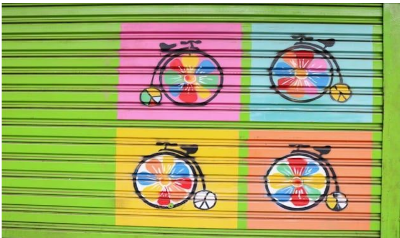
Uma das portas com grafites da Avenida Goiás, no Centro, em Goiânia