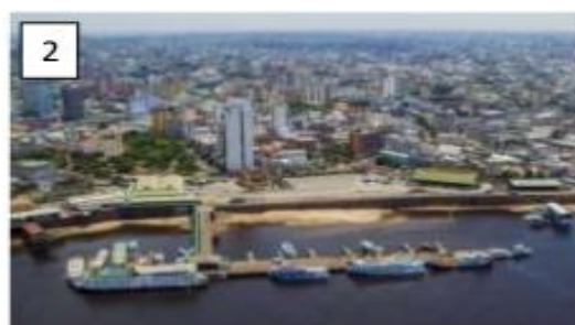
Paisagem em Manaus, estado do Amazonas, em 2013