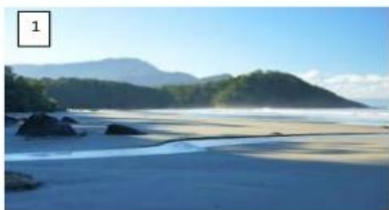
Paisagem de Peruíbe, Estado de São Paulo, em 2014

As paisagens existentes no nosso planeta são diferentes umas das outras. Isso ocorre porque os elementos que formam paisagem são muito variados e estão organizados em diversas maneiras.