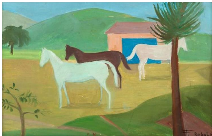
Campo, Francisco Rebolo, 1976