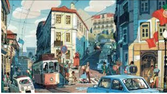
Metrópole, imagem resolução livre, 2017