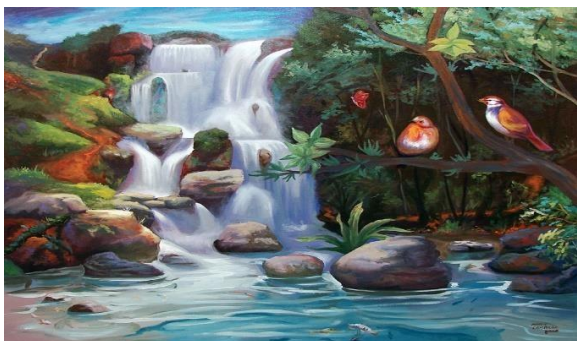
Marcio Camargo, paisagem com pássaros e peixes, 2008

2) Observe as obras e classifique de acordo com o tipo de paisagem.