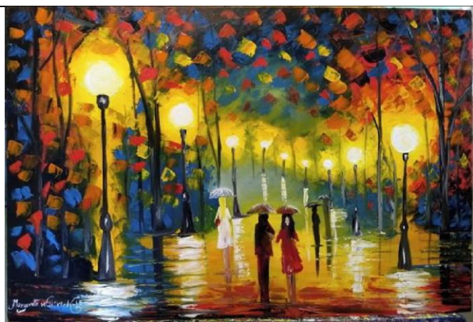
Nighth cityscape, Margarete Waltrick,