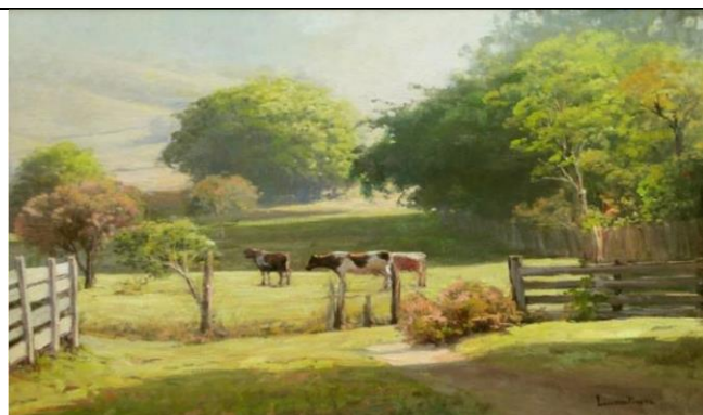
Panorama, Luiz Pinto, 2008