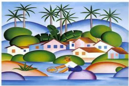
O pescador, Tarsila do amaral, 1925